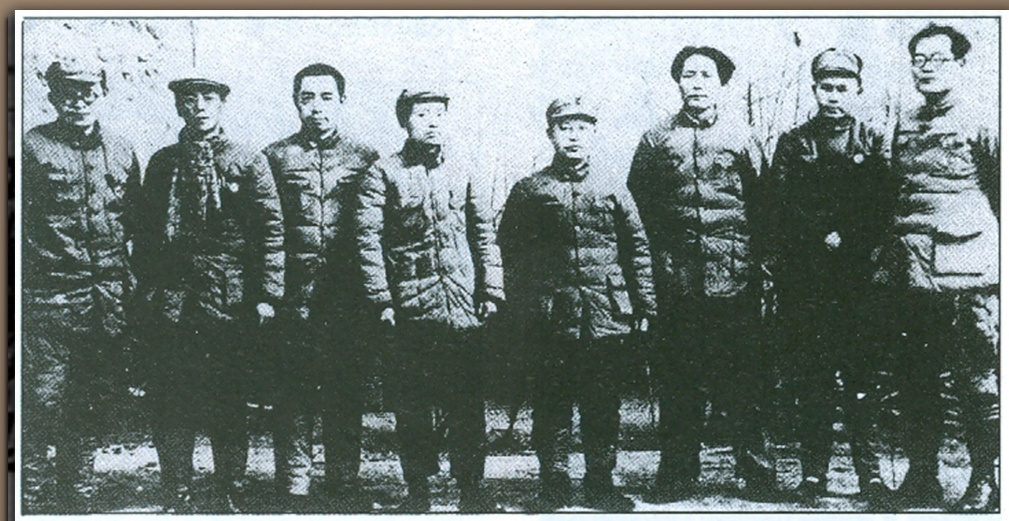
毛泽东（右三）与（左起）张闻天、康生、周恩来、凯丰、王明、任弼时、张国焘在延安时的合照。